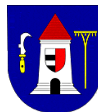
Používaný znak obce